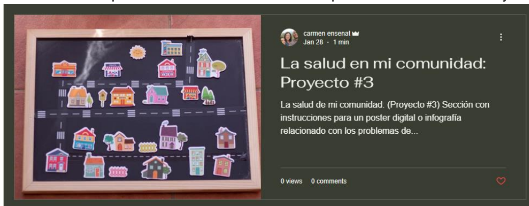
Imagen #3 Captura del Proyecto #3 en el blog

Este módulo pretende desarrollar tareas de expresión e interacción oral y escrita.